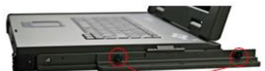
可滑动 15CM 的手拧滑条